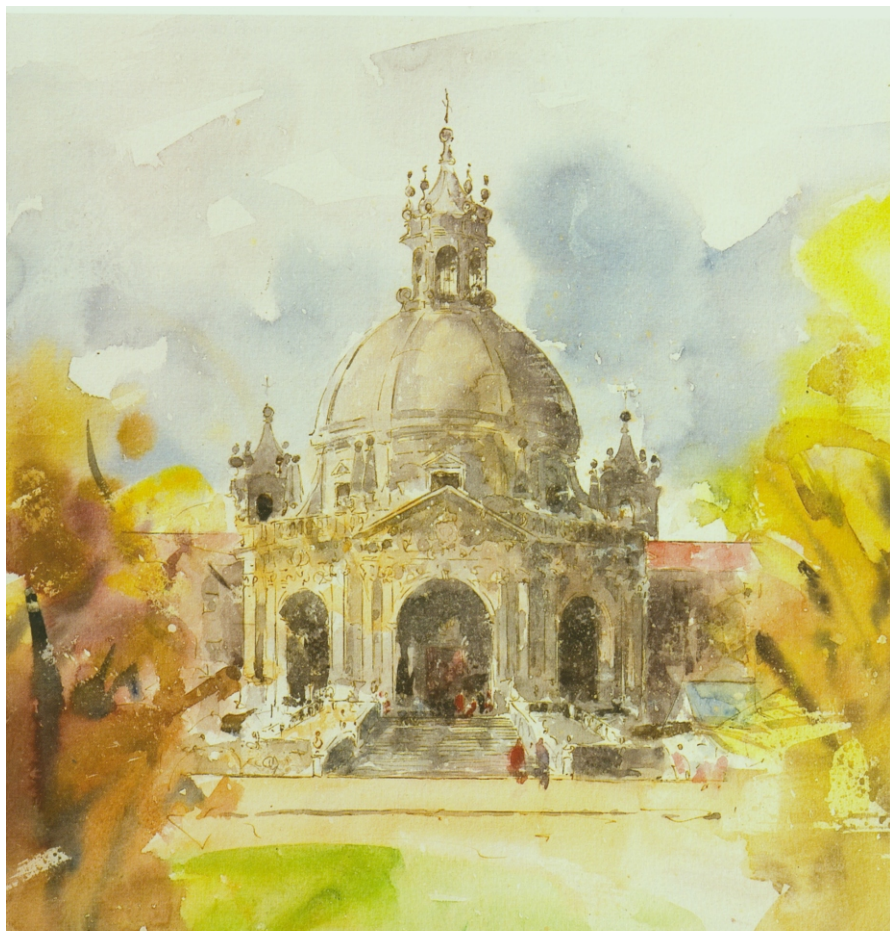
Basilica de Loyola. Acuarela de Javier Sagarzazu